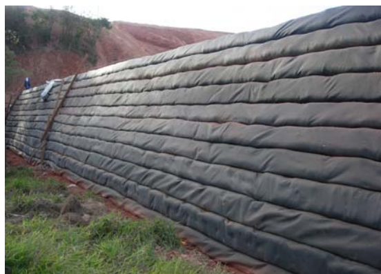
Figura 1 – Vista frontal da construção.

Depois de finalizada a compactação de cada camada, deve ser escavada uma pequena vala a aproximadamente 50 cm da face do muro, com 50 cm de largura e 20 cm de profundidade, na qual a extremidade livre do geossintético será dobrada e encaixada. As mantas deverão ser perfeitamente esticadas sobre a superfície do aterro, para que sejam submetidas a estados uniformes de tensão e, conseqüentemente, de deformação. A Figura 5 apresenta uma vista frontal durante a construção.