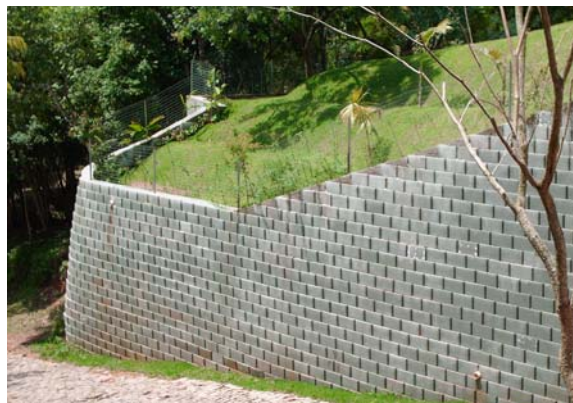
Figura 1 – Acabamento da face com blocos segmentados.

pois não necessita de tempo de espera para a cura de concreto.