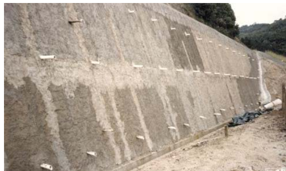
Figura 2 – Acabamento da face com concreto projetado.