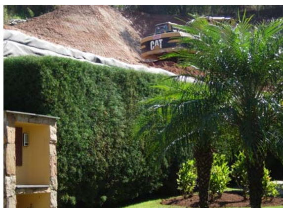
Figura 3 – Acabamento da face com vegetação.